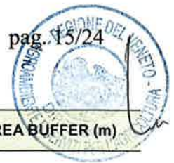
Tabella 18: Definizione dell'area buffer per la fascia riparia