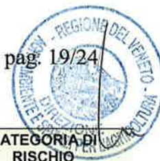
Tabella 22: Soglie di rischio per i parametri dello stato ecologico