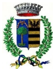
Comune di Gardone Riviera