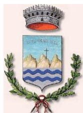
Comune di Tremosine